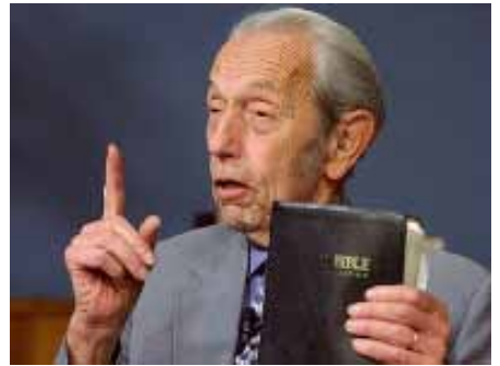
Harold Camping tvrdil, že termíny konca sveta vypočítal vďaka tomu, že rozlúštil biblický kód.