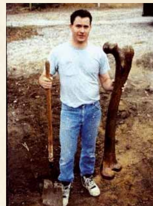
Obrovská ľudská stehenná kosť nájdená v Turecku v 90tych rokoch. South Texas museum.