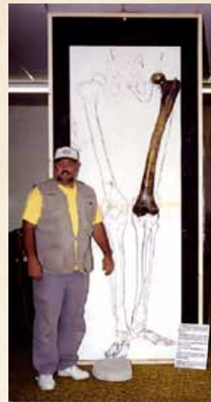
V rokoch 1950, počas výstavby cesty v juhovýchodnom Turecku v údolí rieky Eufrat bolo nájdených veľa hrobov s pozostatkami obrov. Na dvoch miestach sa našli stehenné kosti s dĺžkou 120 cm. Jedna z týchto kostí sa nachádza v Mt. Blanco Fossil Museum, v Texase.